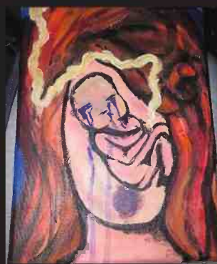
"אין לי יכולת להמשיך". יצירות של שירה

בשלוש השנים שאנחנו בקשר היא נוהגת להתקשר אליי מדי פעם. באחת השיחות הקשות שניהלנו היא התקשרה בזהות אחרת - ואמרה שהיא לא יודעת היכן היא נמצאת, איפה תישן בלילה, ובעיקר סיפרה שהיא רוצה למות. תוך כדי ככי ביקשה שאכתוב לפני שהיא מתה את בקשתה האחרונה: "שהמדינה תראג לבנות לפני שהן מגיעות למצב הזה, שיינתנו להן צ'אנס לחיות. שלא יהרגו אותן לאט־לאט כמו שעשו איתי".